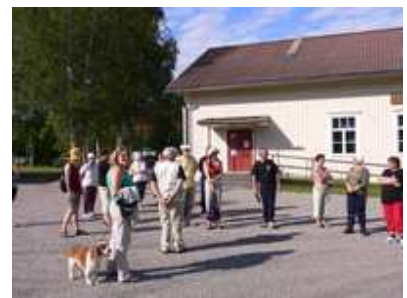
Kuvat kyläkävelyiltä heinäkuussa 2009